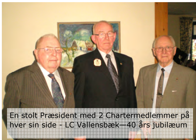
En stolt Præsident med 2 Chartermedlemmer på hver sin side - LC Vallensbæk—40 års jubilæum

Budgetterne på multipel og distrikt er justeret i henhold til de forskellige udgiftsposter og der er taget skyldige hensyn til det positive arbejde der er sat i gang omkring blandt andet samarbejdet omkring uddannelserne og meget andet mellem distrikterne.