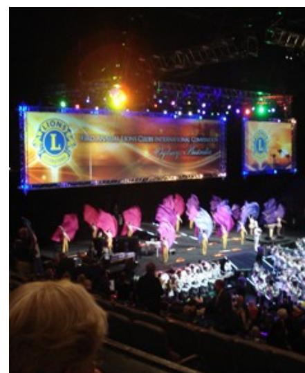
Fra åbningen af Conventionen.