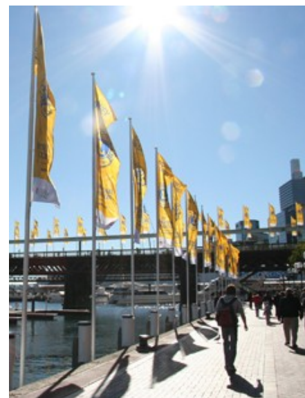
Sydney havde sat alle sejl til, byen var dækket af Lions bannere.