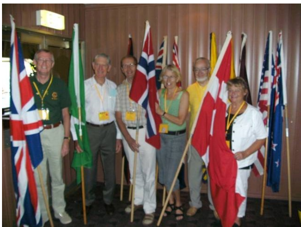
Fanerne skal ind til Convention