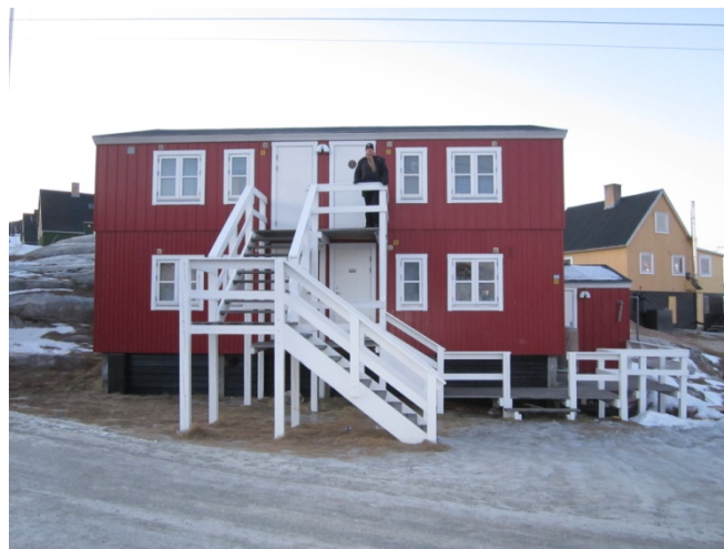
Kollegiet i Ilulissat

For tiden er klubben i gang med at hjælpe den lokale skiklub med etablering af et klubhus. Klubben har foreløbig doneret over kr. 100.000,- og der er sikkert flere penge der følger efter.